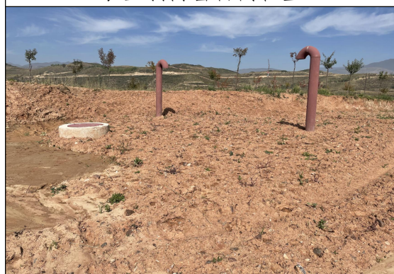
蓄水池工程区土地平整