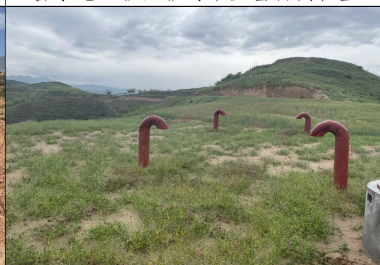
蓄水池工程区植被恢复