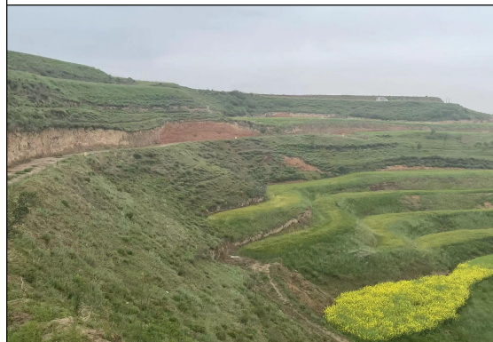
斗管工程区土地复耕