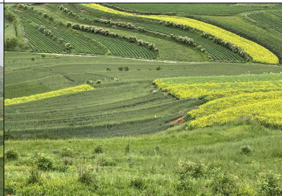
农管工程区土地复耕